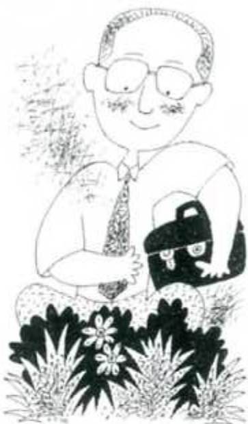
ストレスや疲労が限度を超える前に一息

たとえば、研究者や技術者がデスクワークの時間が長い人などには、この病気が多くみられま