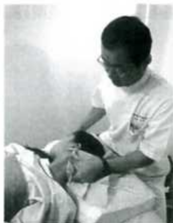
突発性難聴の治療では胸鎖乳突筋をマッサージして緊張をほぐした後、耳や首などのツボを鍼などで刺激