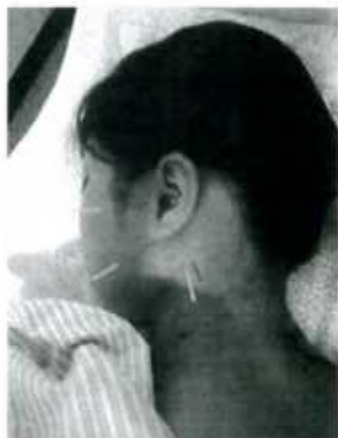
一掌堂治療院のツボ刺激で用いられる突難一号・突難二号に鍼を打ったところ