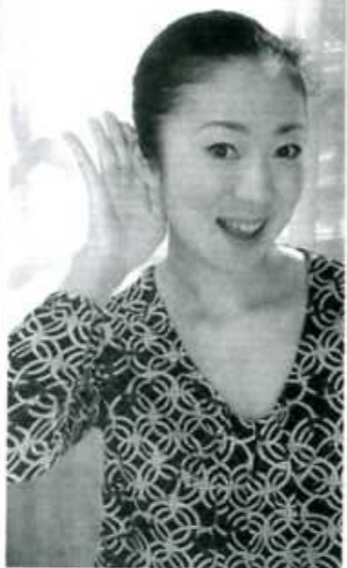
よく聞こえる!耳鳴りも消失!と感謝の声続々!

た自宅での首のV字筋マッサージを妻にやつてもらい、ツボへのお灸なども欠かさず続けていきます。